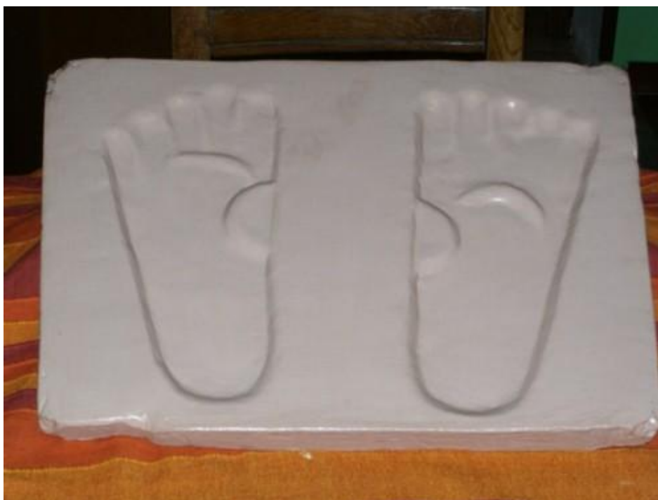
“Le divine Orme di Yuzu Asaph...”